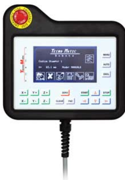
REMOTE PROGRAMMABLE KEYPAD